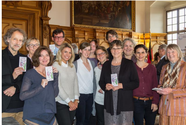
1 Zum Jubiläum überreichten die Eine Welt-Regionalpromotorinnen den Vorständen des EWNB e.V. je eine Tafel SeenLiebe Schokolade

Der aktuelle Rundbrief „April 2019“ aus dem Eine Welt Netzwerk Bayern e.V. mit vielen Infos aus den Mitgliedsgruppen und Glückwünschen zu 20 Jahren Eine Welt Netzwerk Bayern e.V. hier: www.eineweltnetzwerkbayern.de/ewnb/rundbrief