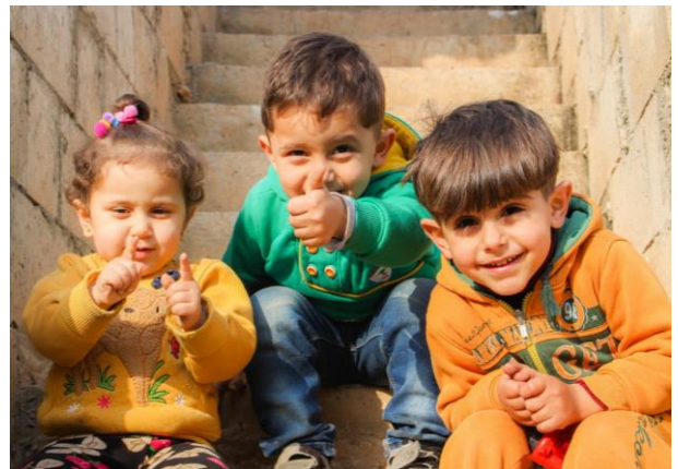
Kinder in Aaqrabâte, Syrien

Download der Kurzfassung des Berichts hier .