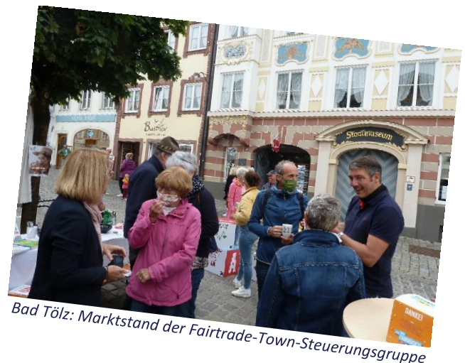
Bad Tölz: Marktstand der Fairtrade-Town-Steuerungsgruppe