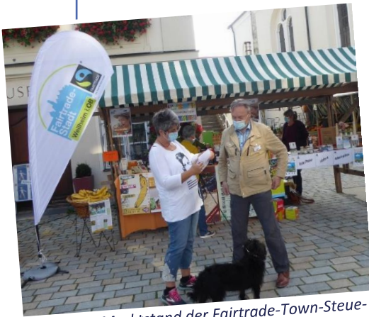
Weilheim: Marktstand der Fairtrade-Town-Steuerungsgruppe mit dem Weltladen und der Solidargemeinschaft „Unser Land“