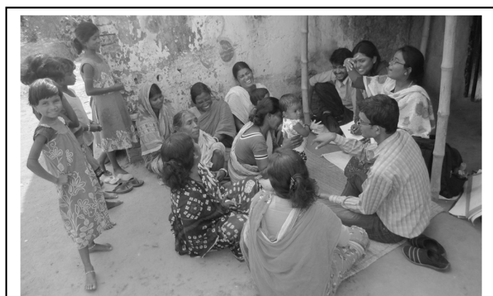
Das Evaluierungsteam von IBRAD während einer thematischen Gruppendiskussion.

Gegen Ende der zweiten Phase im Dezember 2016 beauftragten wir Experten von IBRAD (Indian Institute of Bio-Social Research & Development) mit einer Wirkungsstudie über die Arbeit der letzten 6 Jahre. Solche externen Studien sind wichtig, um zu sehen, ob die Ziele mit dem eingesetzten Personal und den durchgeführten Maßnahmen tatsächlich erreicht werden, ob Aufwand und Nutzen in einem guten Verhältnis stehen, ob es unerwünschte Nebeneffekte gibt. Die Evaluatoren geben Empfehlungen für eine Verbesserung der Arbeit, über Fortführung oder Abschluss von Projekten. Im März 2017 beschloss der Arbeitsausschuss der IH: Wir erweitern das Projekt um den Chatra Gram Panchayat, Herrschings Partnergemeinde, als dritten Standort für eine ökologisch nachhaltige Landwirtschaft und die Stärkung besonders armer Bevölkerungsgruppen in Westbengalen. Wir wollen damit das Trinkwasserprojekt (s. Seite 5) flankieren, z.B. durch ökologischen Landbau im zukünftigen Wasserschutzgebiet, und gleichzeitig ein Zeichen gegen die besorgniserregende Entwicklung weltweit setzen.