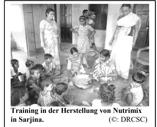
Training in der Herstellung von Nutrimix in Sarjina.