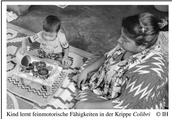
Kind lernt feinmotorische Fähigkeiten in der Krippe Colibri

Das Lake Gardens Women & Children Development Centre ist eine unserer ältesten Partnerorganisationen, mit der wir seit 2005 Krippen für Kinder aus Slums in Kolkata betreiben, um sie sicher zu betreuen und auf die Einschulung vorzubereiten, während die Eltern arbeiten müssen. Immer wieder gibt es in den Krippen und Slumsiedlungen Kinder, die eine verzögerte Entwicklung oder andere Auffälligkeiten zeigen. Daher haben wir im April 2023 Lake Gardens als eine von vier Partnerorganisationen für die Teilnahme an Moving Ahead ausgewählt 1 . Gefördert durch die Schöck-Familien-Stiftung gGmbH startete damals mit Sanchar, unserem Projektpartner für inklusive Behindertenarbeit, unser zweijähriges Projekt Moving Ahead . Seit einem Jahr trainiert, berät und unterstützt Sanchar vier unserer Projektpartner, den Blick auf Menschen mit Behinderungen zu schärfen und das Thema Inklusion in all ihre laufenden Projekte und ihre Organisationsstrukturen zu integrieren.