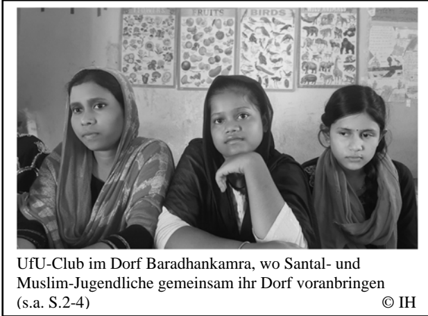
UfU-Club im Dorf Baradhankamra, wo Santal- und Muslim-Jugendliche gemeinsam ihr Dorf voranbringen (s.a. S.2-4)

teilen – lernen – miteinander für eine zukunftsfähige Erde