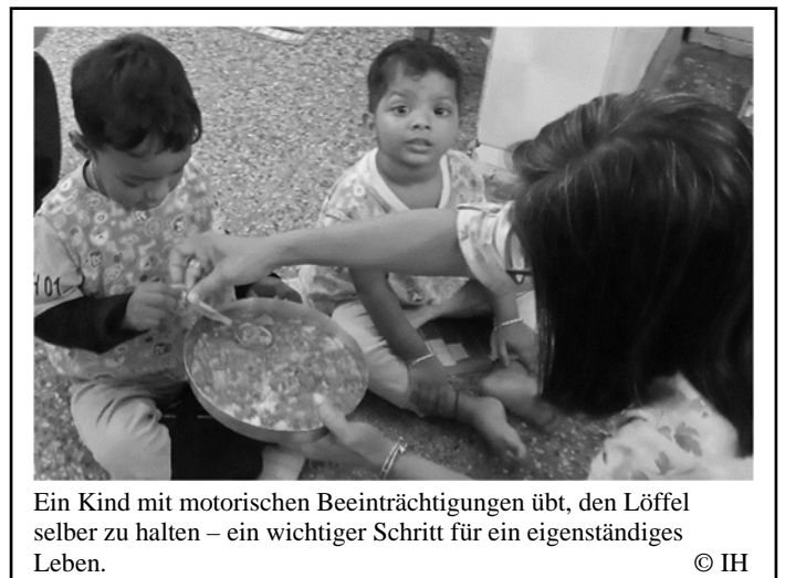
Ein Kind mit motorischen Beeinträchtigungen übt, den Löffel selber zu halten – ein wichtiger Schritt für ein eigenständiges Leben.

In unserem Projekt The Vulnerable Ones mit Lake Gardens werden 65 Kinder im Alter von ein bis fünf Jahren, die in prekären Familien- und Wohnverhältnissen in Slum-Gebieten in Kolkatas Stadtteil Lake Gardens aufwachsen, in drei Krippen betreut und gefördert und bekommen ein nahrhaftes warmes Mittagessen. So können die Eltern, und vor allem die Mütter, einer geregelten Arbeit nachgehen, ohne sich um ihre Kinder Sorgen machen zu müssen. Gleichzeitig beraten die ProjektmitarbeiterInnen die Eltern und die Familien in deren Umfeld zu Themen wie Gesundheit, Hygiene, Eröffnung von Bankkonten, Zugang zu staatlichen Leistungen, beraten die Mütter bei Fällen von (häuslicher) Gewalt. Seit diesem Jahr sensibilisieren sie nun auch für die Bedürfnisse von Menschen mit Behinderungen. In den „Communities“ ist vor allem die Wahrnehmung und Stigmatisierung von Menschen mit Behinderungen und deren Familien ein Problem, aber auch der Zugang zu staatlichen Förderprogrammen und speziellen Therapien. Die meisten Familien sind sehr frustriert und ungeduldig, wenn sie bei ihrem Kind keine oder kaum „normale“ Fortschritte sehen und können diese Verzögerungen nicht einordnen. Selbst, wenn sie die Behinderung ihres Kindes anerkennen und ihm helfen möchten, können sich die meisten Familien einen Therapieplatz nicht leisten oder warten vergeblich darauf.