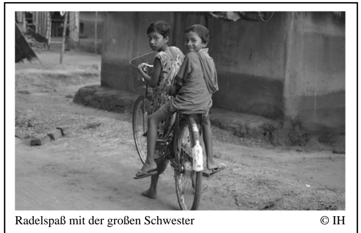
Radelspaß mit der großen Schwester

Sehr positiv bewertete Ujjaini, dass vor Ort nur Mitarbeitende aus der Region tätig sind, die mit den lokalen Gegebenheiten bestens vertraut sind. Sie beobachtete jedoch, dass die Fähigkeiten der Mitarbeitenden sehr unterschiedlich sind. Im Rahmen regelmäßiger Weiterbildungen für alle Mitarbeitenden sowie durch sehr enge Zusammenarbeit untereinander und mit dem Management-Team versucht KJKS, allen die nötige Unterstützung anzubieten und die unterschiedlichen Fähigkeiten auszugleichen. Auch in Zukunft werden Mitarbeiter-schulungen fester Bestandteil des Projekts sein.