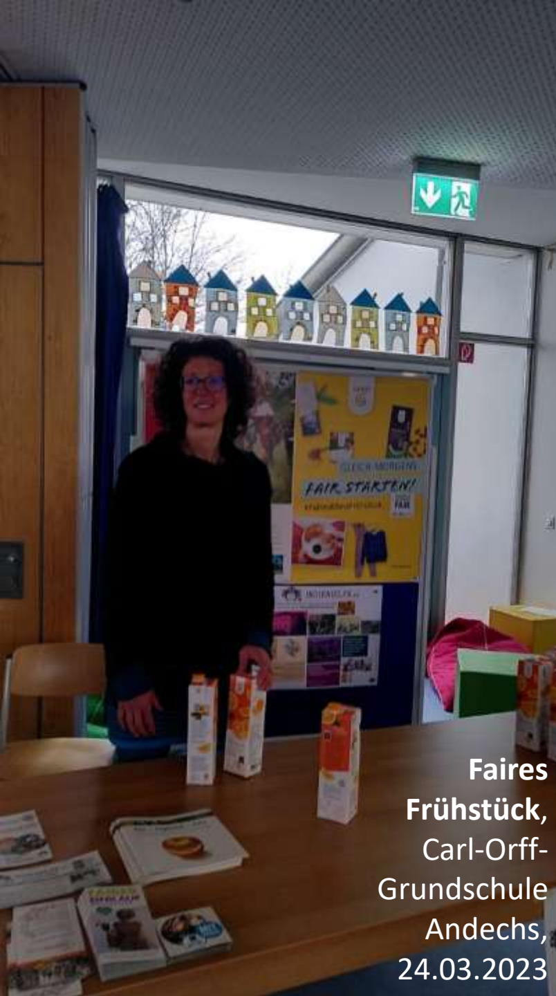
Faires Frühstück, Carl-Orff- Grundschule Andechs, 24.03.2023