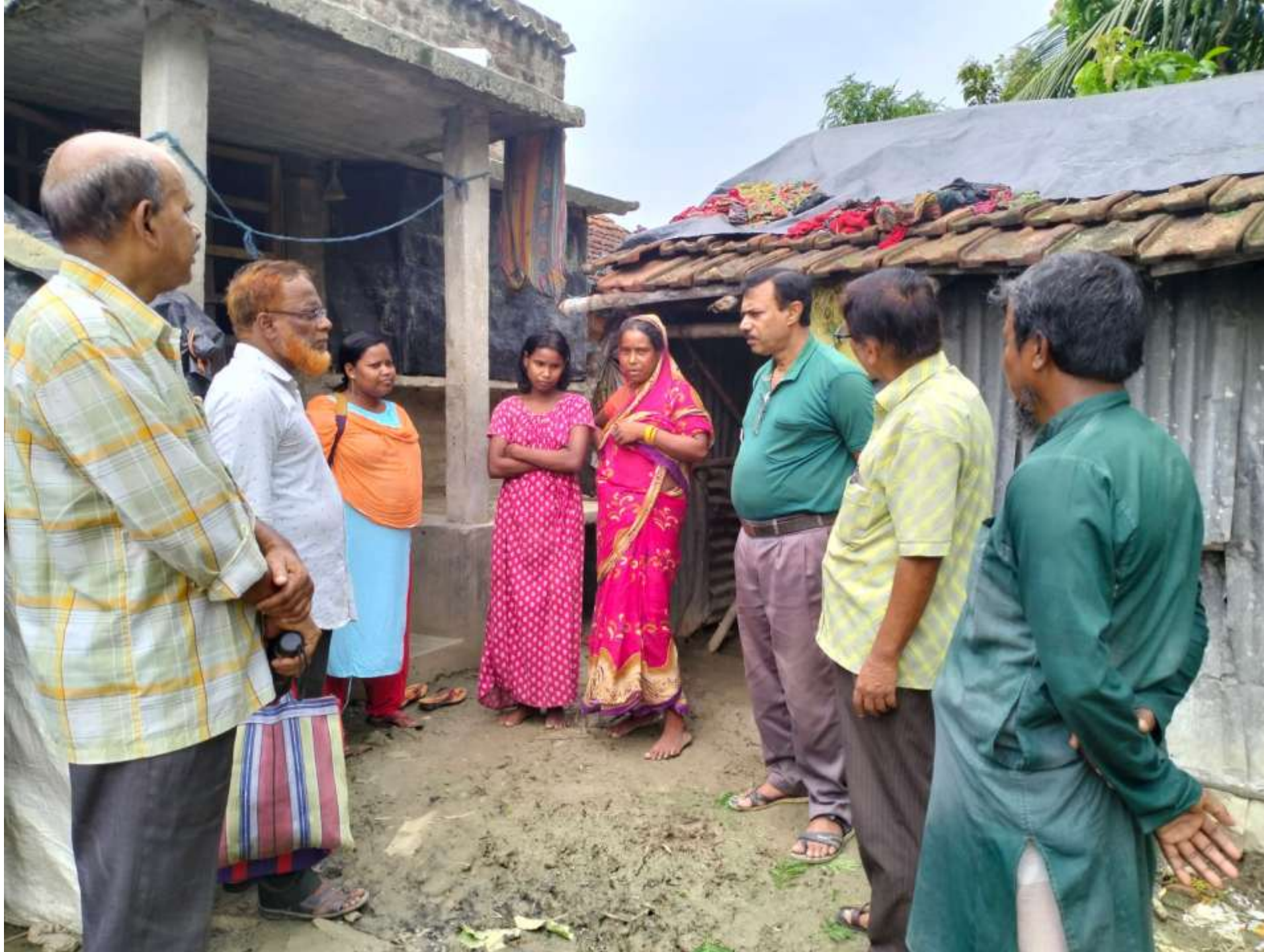
Family visit at Dattapara